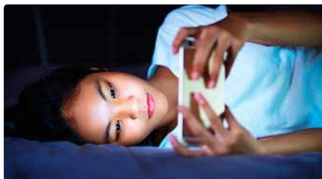
Afbeelding: meer en meer tijd voor het scherm betekent meer blootstelling aan blauw licht

goede SPF bescherming en huidverzorgingsproducten vol anti-oxidanten de beste wetenschappelijk onderbouwde manier om de negatieve gevolgen van blauw licht zoveel mogelijk te beperken. Omdat voorkomen altijd beter is dan genezen ben ik van mening dat je je huid maar beter kunt beschermen tegen de mogelijke schadelijke invloeden van dit blauwe licht. We kunnen onze klanten wijzen op deze mogelijke invloeden op de huid tijdens de lockdown of tijdens tijd van beperkingen, en zo goed mogelijk adviseren welke gelaats verzorging up-to date is om deze huid-uitdagingen het hoofd te bieden.